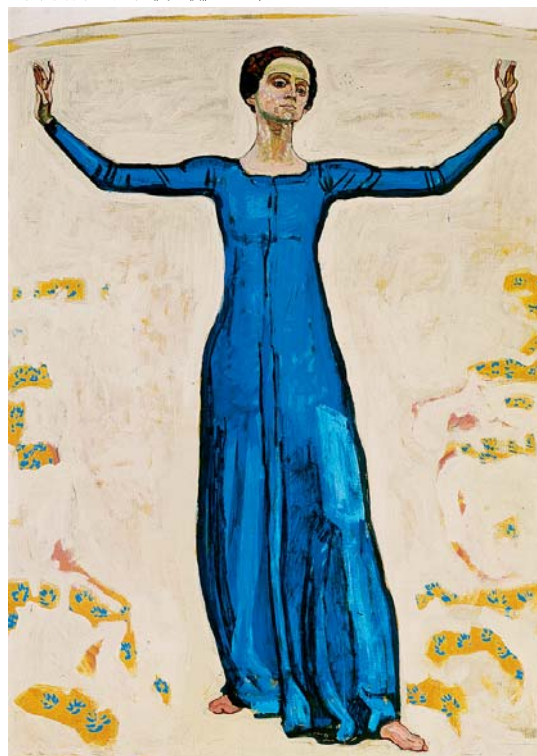
フェルディナント・ホドラー《遠方からの歌》1917年頃