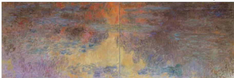
クロード・モネ《睡蓮の池、夕暮れ》1916/22年