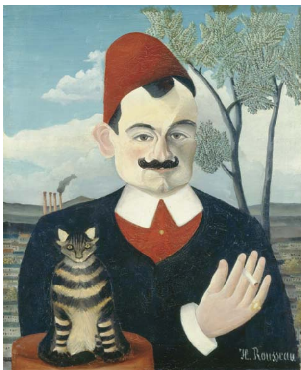
アンリ・ルソー《X氏の肖像(ビエール・ロティ)》1906年