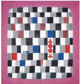
パウル・クレー《スーパーチェス》1937年