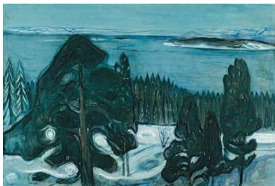
エドヴァルド・ムンク《冬の夜》1900年