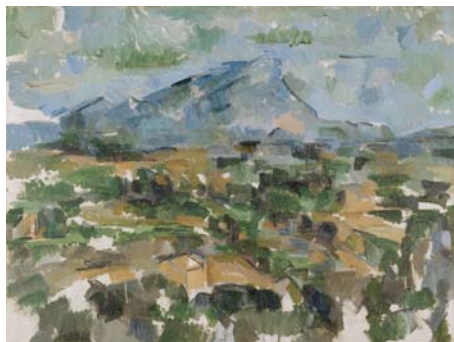
ポール・セザンヌ《サント=ヴィクトワール山》1902/06年