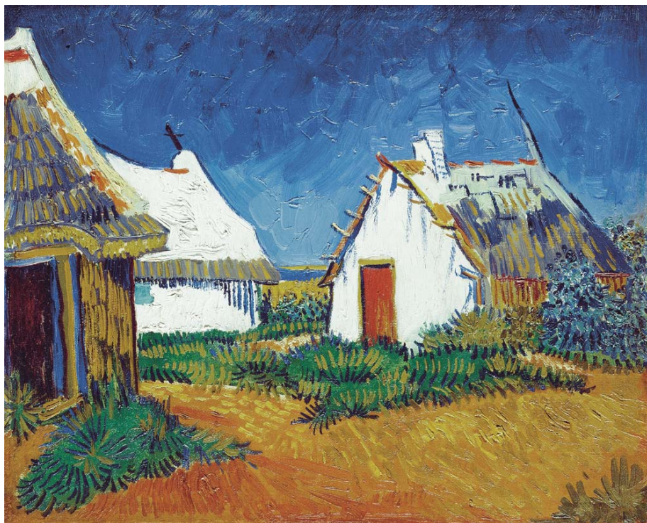
フィンセント・ファン・ゴッホ《サント=マリーの白い小屋》1888年