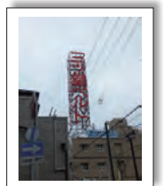
三ツ星ベルトの立体看板