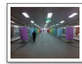
国道2号線下の地下道

国道2号線の地下は阪神淡路大震災の展示空間となっています。当時焼け残った「神戸の壁」は、基礎部分がベンチとして活用されています。