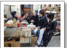
駄菓子 サカキン Tel.078-681-3890

駄菓子サカキン(坂本キンキパン)は地元の子供に大人気の名店。店内は子供達の掲示板のような風情となっています。隠れメニューのたこせんまヨネーズ醤油がオススメ。