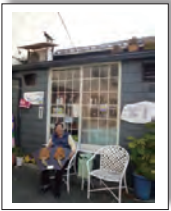
駄菓子 フレンド Tel.078-621-4367