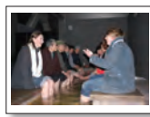
新長田ふれあい足湯