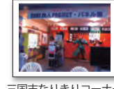
三国志なりきりコーナー

「三国志なりきりコーナー」では、ワンコインで三国志のコスプレが楽しめます。好きな衣装を着て、記念撮影はいかがですか？その他三国志関連の資料も展示しています。