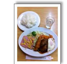
マルヤ食堂 浜中店 Tel. (078)-651-5375

路地もめっきり少なくなった御崎公園駅近くに、昔ながらの佇まいで営業されている「洋食マルヤ」。オムライスやAランチなど、昔と同じ懐かしい味を楽しんでまちあるきを締めくくり！