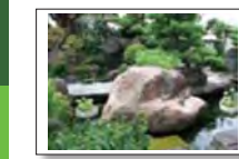
(引用：兵庫区歴史さんぽ道シリーズ)