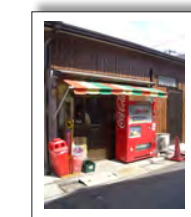
駄菓子 中川 Tel. (078)-671-9445