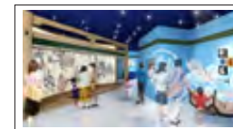
(引用：KOBÉ de 清盛 2012パンフレット)