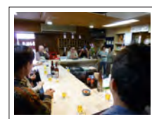
清水酒店 Tel. (078)-651-2380