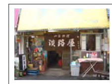
クレープと駄菓子のお店 淡路屋 Tel. (078)-671-1939

昭和の雰囲気満点の下町レトロに首っ丈の会総本部の「淡路屋」さん。ソースとだして楽しむ「神戸たご焼き」でも有名なお店は、まちの情報を教えてくれる拠点となっています。