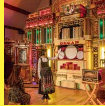
六甲オルゴールミュージアム