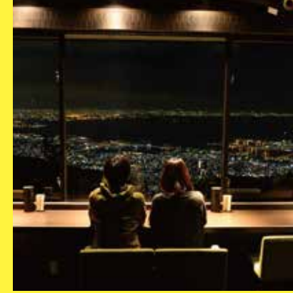
TENRAN CAFE (天覧台)