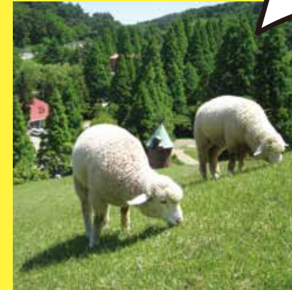
神戸市立六甲山牧場