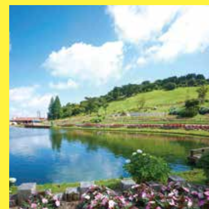
六甲山カントリーハウス