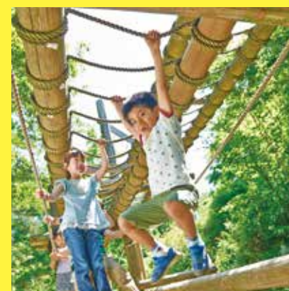
六甲山フィールドアスレチック